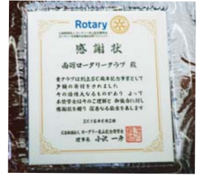
特別寄付感謝状クリスタル楯

※次週7/31(火)は休会です。次の例会は8/7(火)納涼家族会です。 ※7/29(日)小矢部川河川清掃ならびに小矢部川ふれあいフェスティバルですが、当初10:00清掃開始でしたが9:30清掃開始に変更致します。