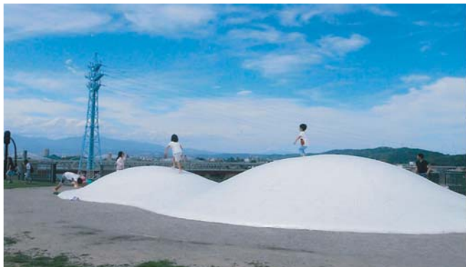
富山県立美術館屋上のトランポリンで遊ぶ子供達