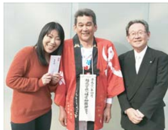
福光宇佐八幡宮春季大祭にて(4/21)

4月1日、新元号“令和”が公表され、その新元号への期待感とは裏腹に、4月1日がやってきてしまったことに絶望感を覚えている人達がいらっしゃいます。新社会人たちです。今日を境に“社会人”となり、言動の責任も学生時代より当然大きくなり社会から大人の立ち振る舞いが求められる訳ですが、日付とともに本人の資質や能力、責任感が向上する訳でもありません。一方的に押し付けられた“社会人”の肩書が、最初は自分に釣り合わなくても、腹をくくって徐々に合わせていくしかないわけです。“引越しの準備をしながら考えたけど、地元就職すれば良かったとつくづく思う”“入社辞退したい”“人生最後の休日”など、まだ社会人になりたくないと思う新社会人の悲痛な叫びが次々と寄せられております。