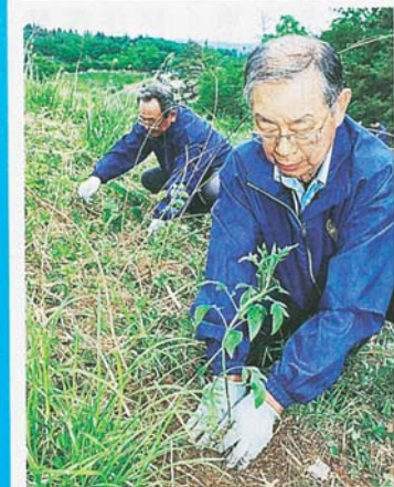
オミナエシの苗を植える南砺RCのメンバー ＝南砺市桜ヶ池公園