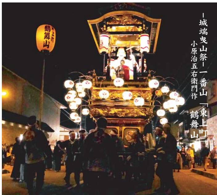
「城端曳山祭」一番山「東上町」鶴舞山 小原治五右衛門作