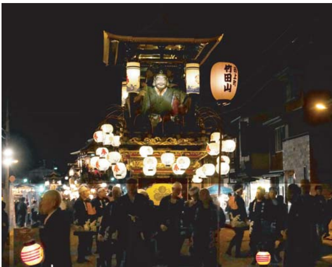
城端曳山祭 提灯山 (竹田山 西上町)

身の代金を取る目的で、人を誘拐した場合(身の代金目的誘拐) 子供に食事を与えず、放置したため死亡してしまった場合(保護責任者遺棄致死) 財産上の利益を得る目的で覚せい剤を密輸入した場合(覚せい剤取締法違反)等々、重大な犯罪の疑いで起訴された事件であり、今年3月までの10年間で、延べ13,978人が裁判員として裁判に関わっており、その内一番多いのが強盗事件で3,267人、2番目が殺人事件で3,055人となっており、3番目が現住建造物等放火で1,385人となっております。では最後に、もし裁判員に選任された場合、何日間関わるのか?気になる所ですが、平均実審理期間は8.1日で、平均開廷回数は4.4回だそうです。