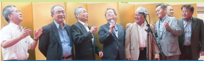
「川合年度」の船出を寿ぎ福光めでた」を唄いあげる民謡同好会の皆さん

・縁のある福島相馬地方のクラブとの交流のきっかけを作る 以上のつながりの広がりが新たな会員へのつながりを生み出す