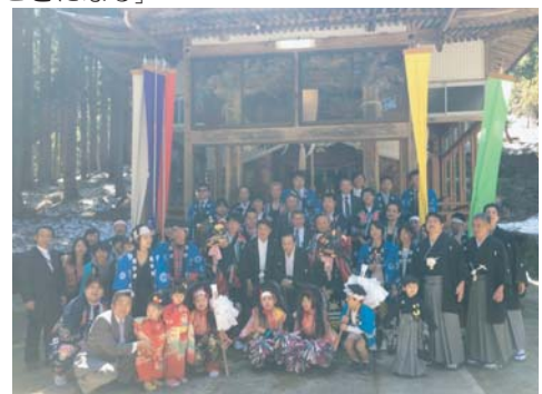
この祭りがいつまでも続けられますように!

クロモジ…芳香 効能。 クスノキ科 落葉低木 漢方名「烏樟」某薬用酒の原材料 爽やかな芳香。茶道では和菓子の爪楊枝。資源利用の最適化…採った資源を使い切るために!。キハダの利用木目がきれい。黄色い内皮が生薬の「黄檗」器具の材料として活用 ホオノキの寄木で作ったまな板樹皮は生薬「和厚朴(わこうぼく)」イタヤカエデ 春先に樹液を採取。40倍くらい煮詰めると、メープルシロップになります。