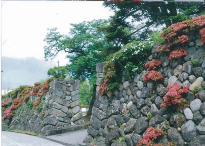
第2519回例会 令和元年9月10日(火) 晴れ