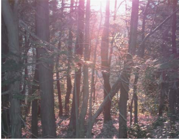
木々の間にも夕焼けが：