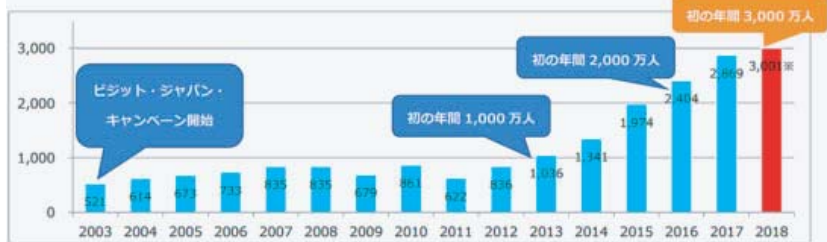
資料: 年別訪日外国人旅行者数の推移 (2003年～2018年12月18日)

訪日外国人旅行者数の推移 2018年、過去最高の3千万人を突破 2020年までに4千万人を目標 ※コロナの影響により、2020年4～6月は99.9%減