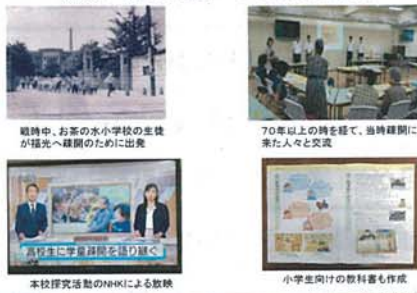
福光中、お茶の水女子大の生徒が福光へ疎開のために出発