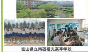
富山県立南砺福光高等学校