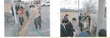
富山県立南砺福光高等学校

本校のボランティア活動は非常に盛んであり、昨年度は2学期まで延べ597人(1人あたり1.94回)一昨年度は年間延べ1180人(1人あたり3.74回)これは、富山県内高校の平均を大きく上回っている。例えば、プチボランティアを不定期で開催しているが、参加希望者はとても多い。