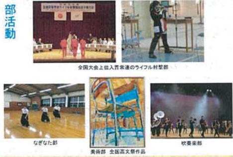
全国大会上位入賞常連のライフル射撃部