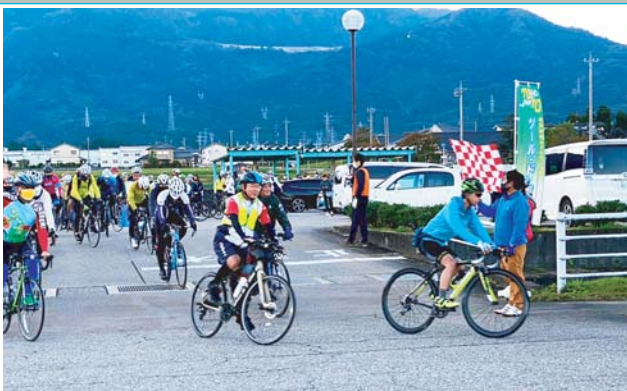
ツール・ド・南砺