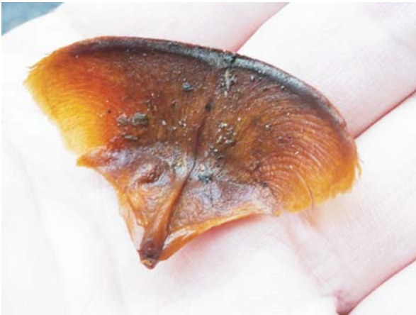
雨にぬれたシダロービスの花びら