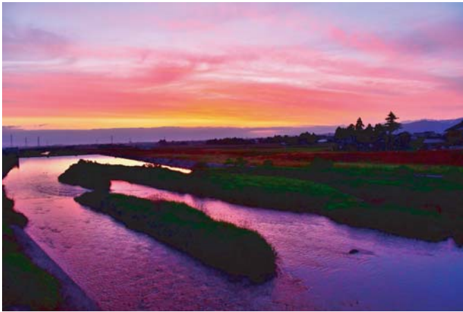
「川面も焼ける朝焼け6・13」