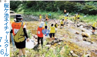
桜ヶ池ネイチャースクール 7月16日