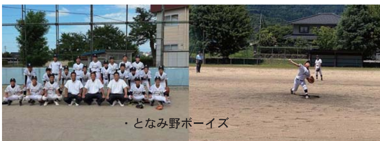
・となみ野ボーイズ

R C会員の方々ののおかげで中学生の野球クラブが成立し笑顔や感動を見ることができている。小矢部市、砺波市、南砺市3市の中学生が福光高校のグラウンドで活躍している。実をいうと高岡商業高校野球部甲子園組ベンチ入りは、中学生時代硬式野球をしていたメンバーが12名、軟式野球経験者が6名とのことで、より早くから硬式ボールを握ることが効果あり。