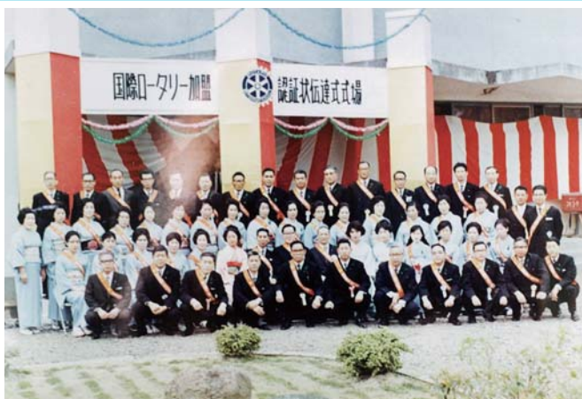
「認証状伝達式会場」県立福光高校69年5月25日