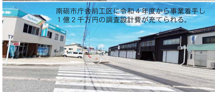
南砺市庁舎前区に令和4年度から事業着手し1億2千万円の調査設計費が充てられる。