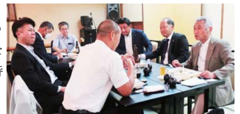
(今回の会報担当・牧千収)