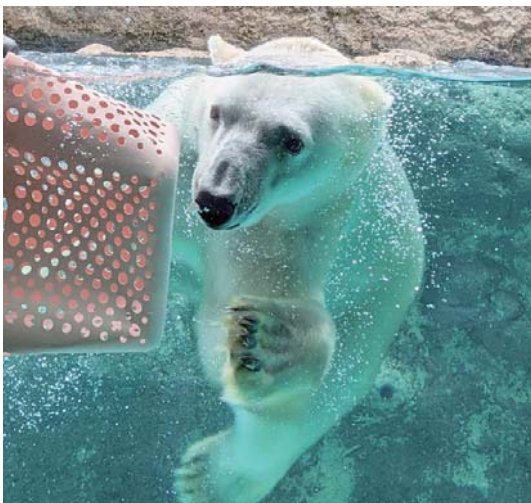
北海道・旭山動物園「白熊の赤ちゃん」