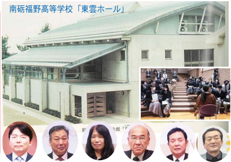
南砺福野高等学校「東雲ホール」