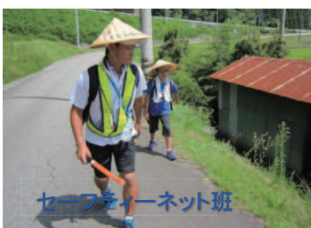
セーフティーネット班