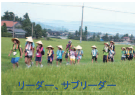
リーダー、サブリーダー